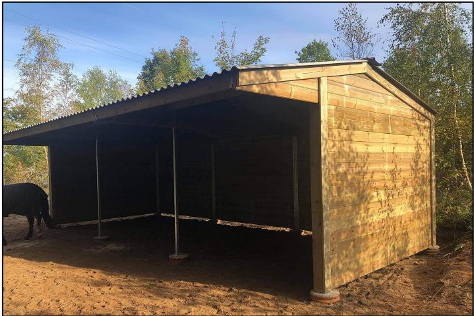
Foto-eksempel på læskur