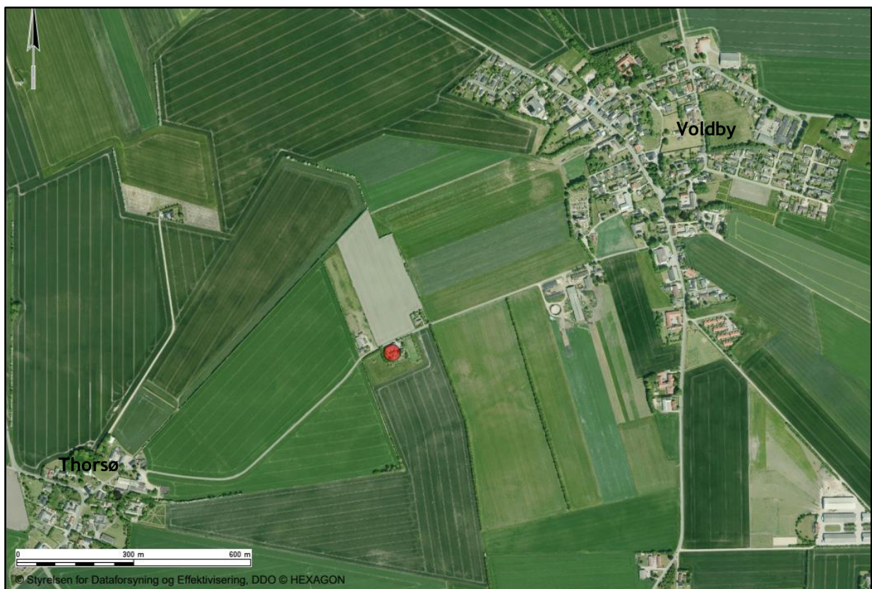
Luftfoto visende ejendommens beliggenhed (rød prik) mellem byerne Thorsø og Voldby

Norddjurs Kommune meddeler hermed landzonetilladelse efter planlovens § 35, stk. 1, til opførelse af et læskur til heste på adressen Thorsøvej 11, 8500 Grenaa, matr.nr. 15 Thorsø By, Voldby.