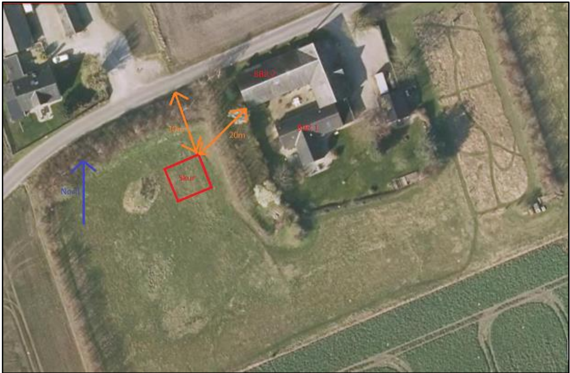
Situationsplan visende læskurets placering på ejendommen