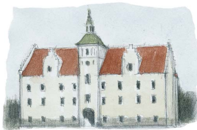
Illustrationer: Lars Sand Kirk

Arealerne huser en stærk kerne af kronvildt. Specielt i efteråret er der god mulighed for at se - og ikke mindst høre den store bestand af dyr.